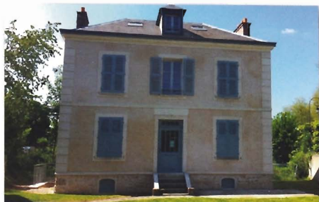
Logement SNL à Cernay la ville