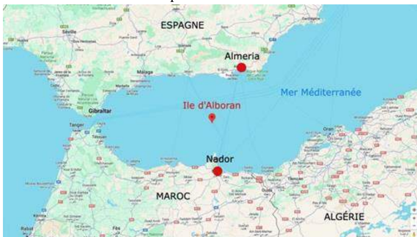
Figure 2 L'île espagnole d'alboran se trouve en face d'Almeria et de Nador.

Le week-end dernier, samedi 24 et dimanche 25 février 2024, près de 200 personnes ont débarqué sur cet îlot espagnol inhabité au large d'Almeria, où est installée une unité de la Marine. Rapidement après les arrivées d'exilés en petits bateaux à moteur, plusieurs transferts ont été opérés en hélicoptères. Dimanche après-midi, les secours ont emmené une femme et quatre mineurs vers l'hôpital universitaire de Torrecárdenas, à Almeria. Quelques heures plus tôt, dans la matinée, un homme qui présentait de forts symptômes d'hypothermie a également été évacué. À son arrivée sur la péninsule ibérique, l'homme était " conscient et stabilisé ". Il a ensuite été transféré en ambulance à l'hôpital. Il est mort vendredi 1er mars, à l'hôpital universitaire Torrecárdenas d'Almeria. Aucune information n'a été fournie quant à son identité.